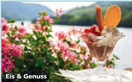
Eis & Genuss