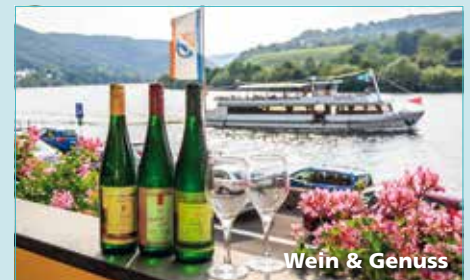
Wein & Genuss