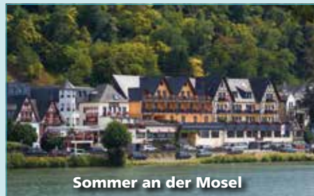
Sommer an der Mosel