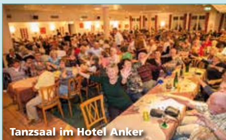
Tanzsaal im Hotel Anker